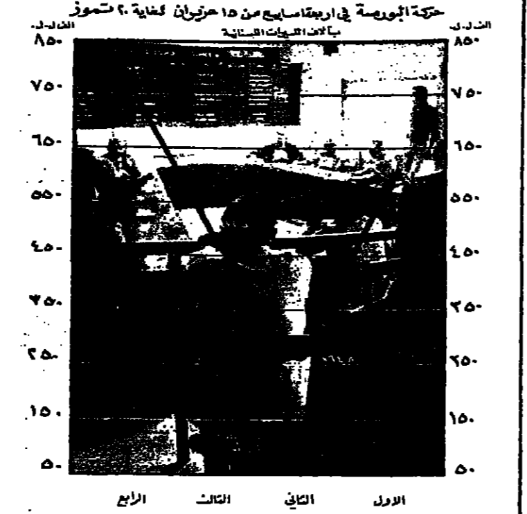
العملات المتداولة في سوق البورصة اللبنانية.